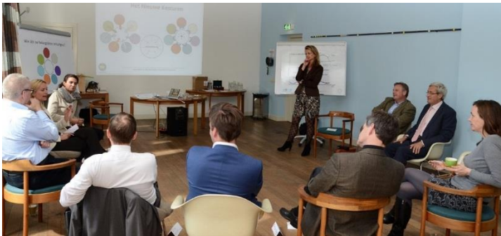
Trainingsopstelling van NieuwBestuur, open en transparant

De Nieuwe Bestuurstafel is een manier van kijken naar jezelf en je bestuur in een veilige vertrouwde setting. Het is een ervaring die ik ieder bestuurder gun."